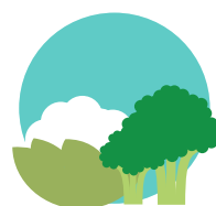
Brocoli et chou