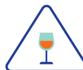
La consommation d'alcool