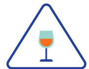
La consommation d'alcool